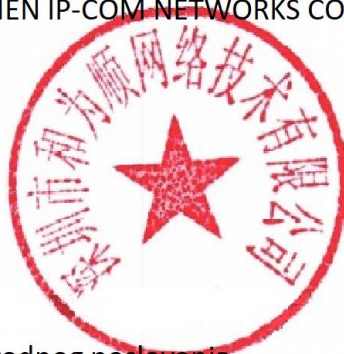
Zhou Jun Menadžer prodaje međunarodnog poslovanja